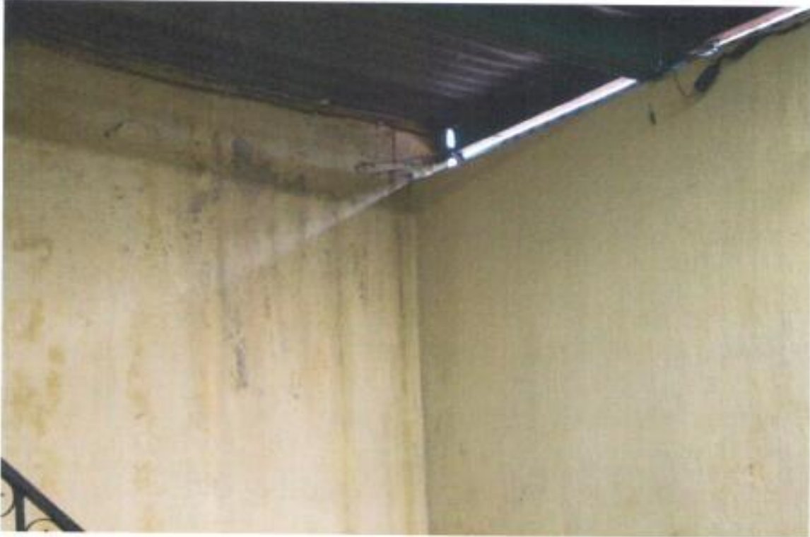
Fotografías de visita al albergue de Coatepeque.